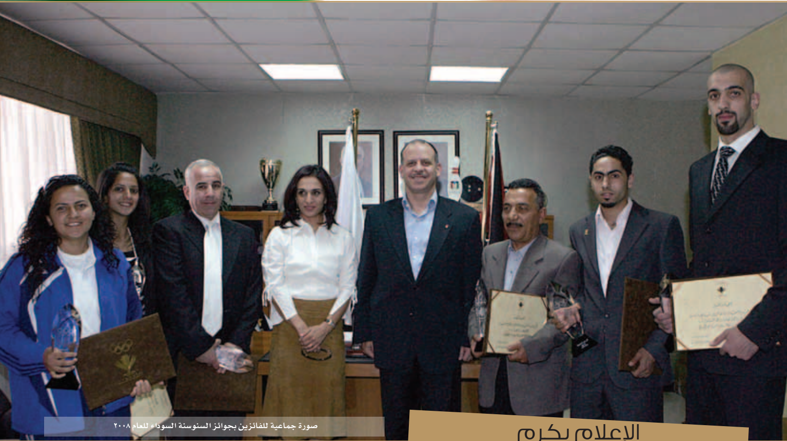
صورة جماعية للفائزين بجوائز السنونة السوداء لعام ٢٠٠٨