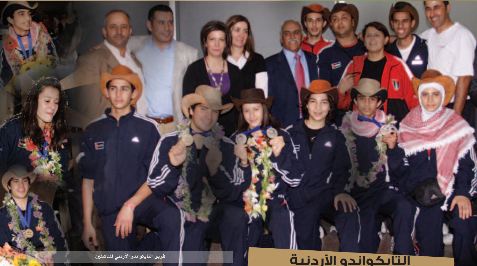
فريق التايكواندو الأردني للناشئين