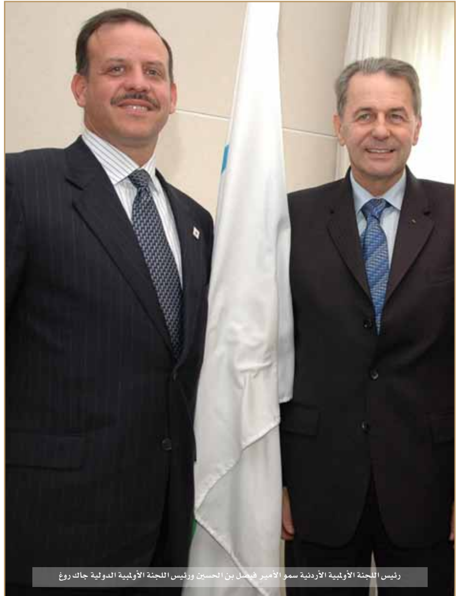
رئيس اللجنة الأولمبية الأردنية سمو الأمير فيصل بن الحسين ورئيس اللجنة الأولمبية الدولية جاك روغ

وحظيت مبادرة سموه -اجيال السلام- باهتمام عالمي لاستخدامها الرياضة كوسيلة لتقريب وجهات النظر في المجتمعات التي تعاني من النزاعات.