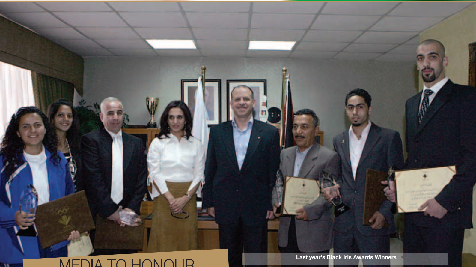
Last year's Black Iris Awards Winners