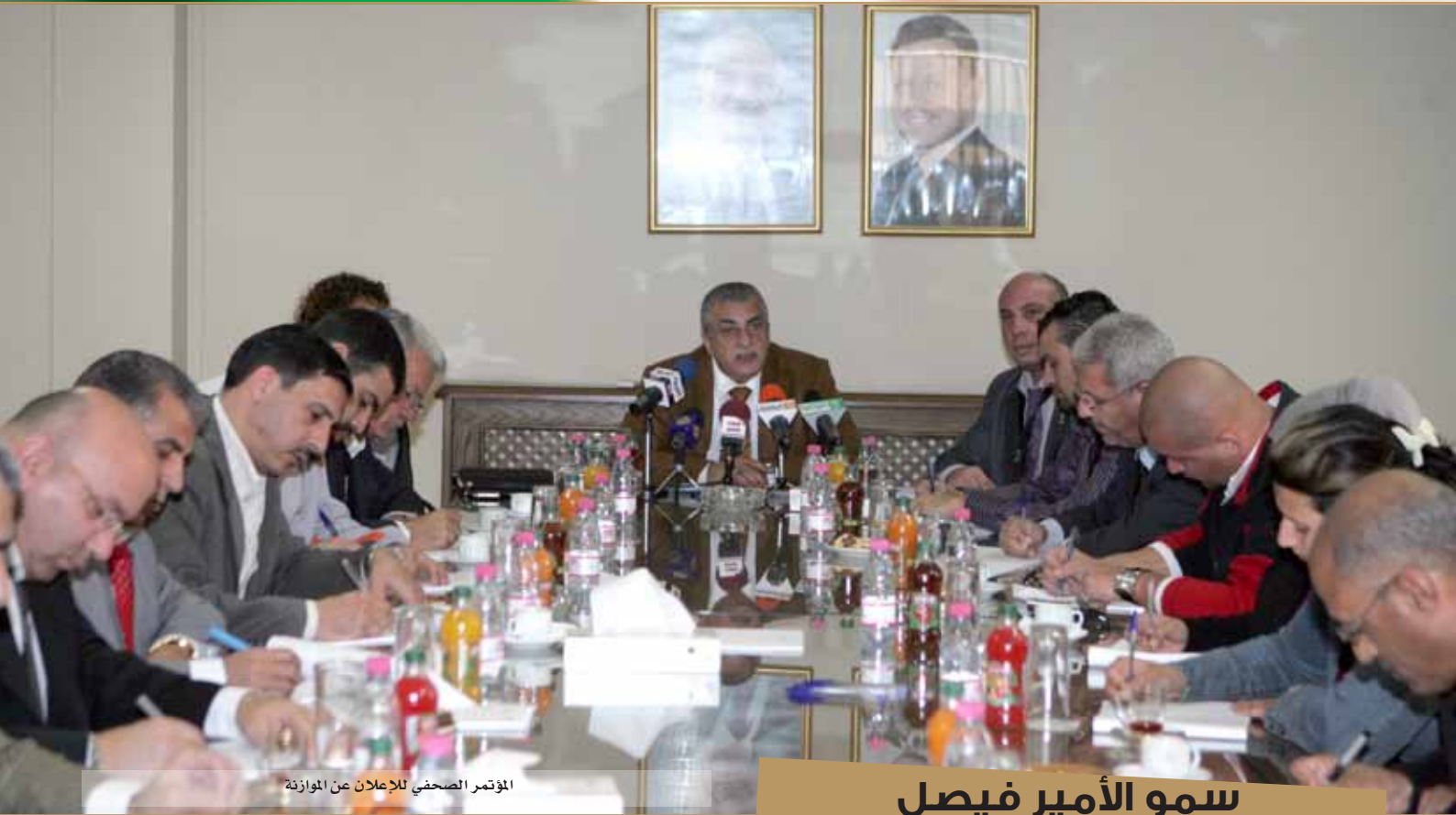
المؤتمر الصحفي للإعلان عن الموازنة