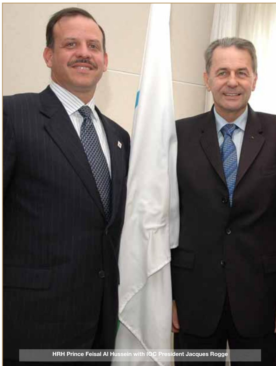
HRH Prince Feisal Al Hussein with IOC President Jacques Rogge

His Royal Highness Prince Feisal Al Hussein, President of the Jordan Olympic Committee (JOC) and Chairman of Generations For Peace, has been elected as a member of the International Olympic Committee (IOC).