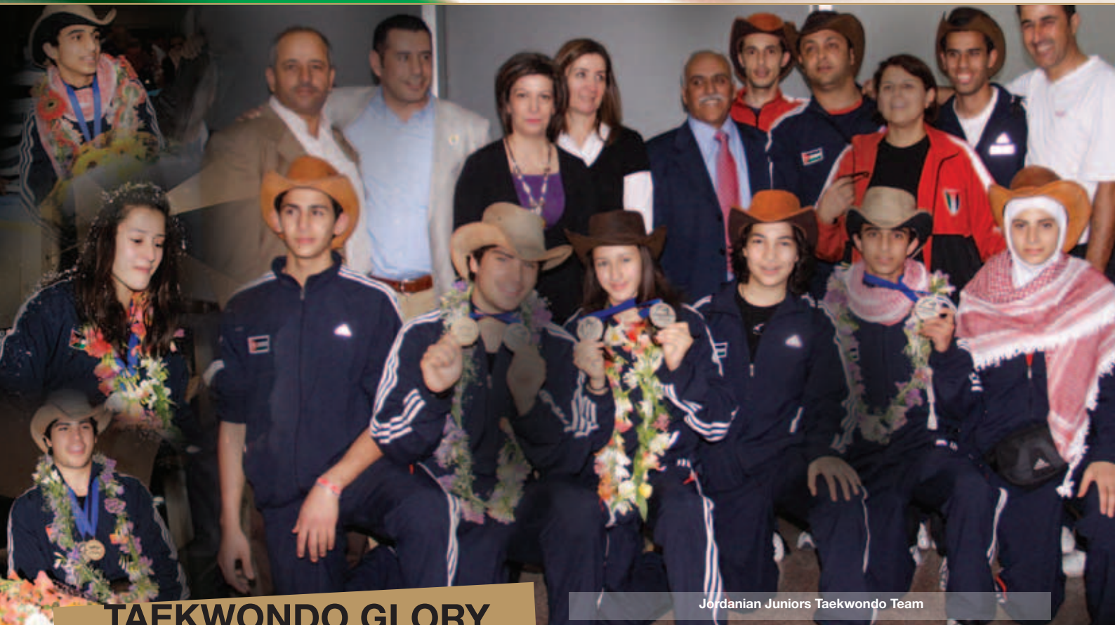
Jordanian Juniors Taekwondo Team